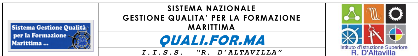
FIGURE DEL SISTEMA GESTIONE QUALITÀ